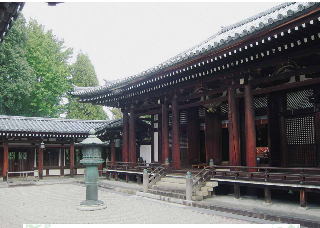
ひの たんじょういん 日野誕生院 (京都市伏見区日野)

親鸞聖人の誕生を顕彰し、誕生地に建てられました。境内に聖人産湯の井戸があります。