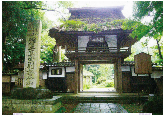
さいねんじ 西念寺 (茨城県笠間市稲田)

親鸞聖人の誕生を顕彰し、誕生地に建てられました。境内に聖人産湯の井戸があります。