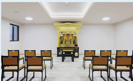
合同納骨室は、本館2階法要室(写真)のご本尊の裏にあります。

関心をお持ちの方や何かご相談等あれば、寺までお気軽にお問い合わせください。更に詳しい内容が書かれたパンフレットをお渡しし、ご説明させていただきます。