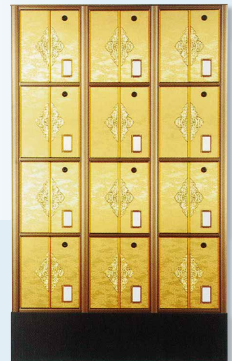
←多段式(ロツカー式)納骨壇